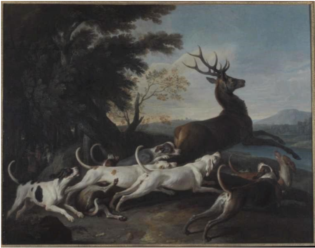
Alexandre-François Desportes Le débûché du cerf 1748 Inv. 811.49 Salle 2.18