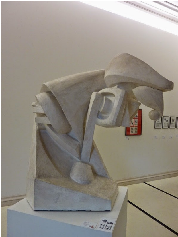
Raymond Duchamp-Villon Le cheval majeur 1914 Inv. 985.3.1 Salle 1.28