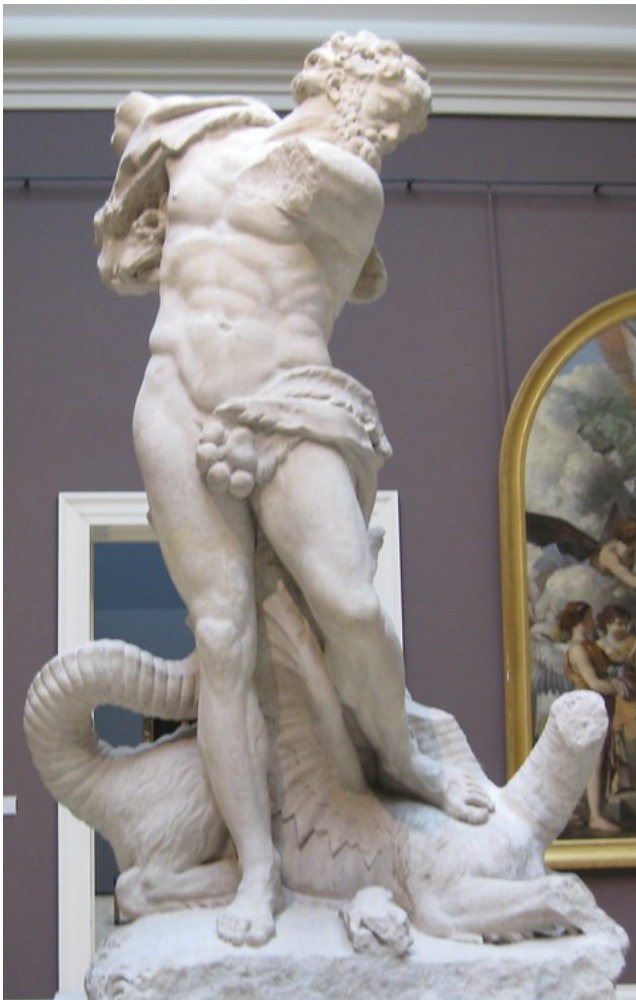
Pierre Puget Hercule terrassant l'hydre de Lerne Vers 1659-1660 Pierre de Vernon Inv. 884.12.1