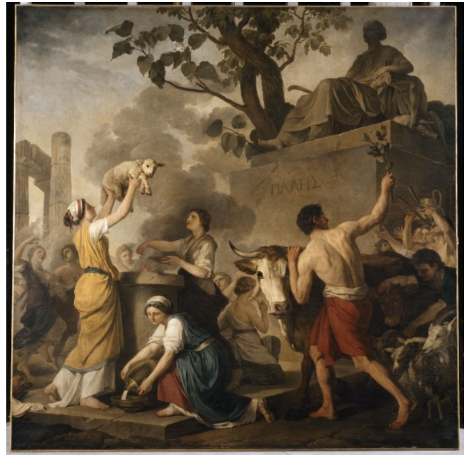
Joseph-Benoît Suvée Fête à Pallès 1783 Inv.D.874.4 Salle 2.20