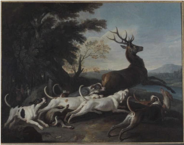
Alexandre-François Desportes ( né en 1661, mort en 1743) Le débûché du cerf Peint en 1748 Huile sur toile Salle 2.18