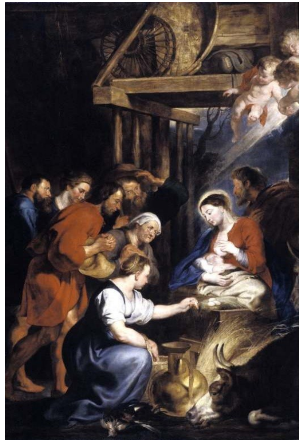
Pierre-Paul Rubens ( né en 1577, mort en 1640 ) L'adoration des bergers Peint en 1619 Huile sur toile Salle 2.3