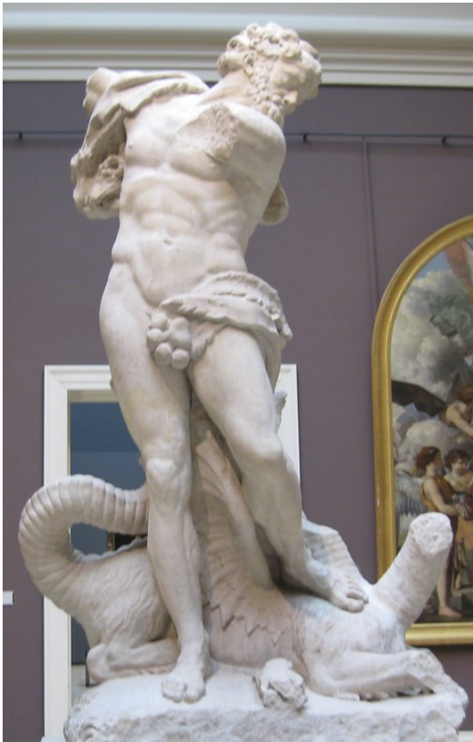
Pierre Puget (né en 1620, mort en 1694) Hercule terrasant l'hydre de Lerne Sculptée vers 1659-1660 Pierre de Vernon Salle 2.8