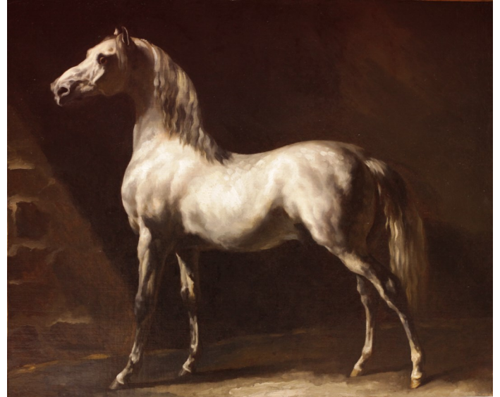
Théodore Géricault (né en 1791, mort en 1824 ) Cheval arabe blanc gris Vers 1812 Huile sur toile Salle 2.31

La caravane Peint vers 1635 Huile sur toile Salle 2.10