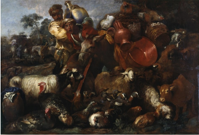
Giovanni Benedetto Castiglione (né en 1609, mort en 1664)

La caravane Peint vers 1635 Huile sur toile Salle 2.10