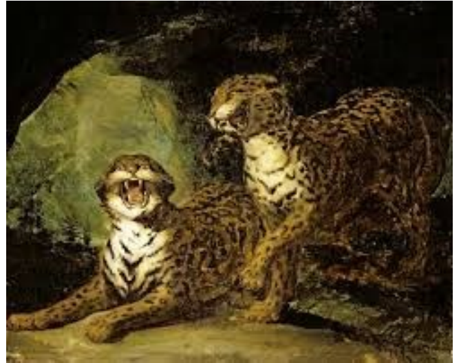
Théodore Géricault (né en 1791, mort en 1824 ) Deux léopards Peint vers 1820 Huile sur toile Salle 2.31