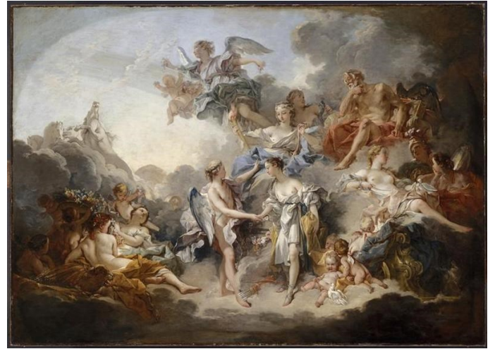
François Boucher (né en 1703– mort en 1770) Le mariage d'Amour et Psyché Peint 1744 Huile sur toile Salle 2.18