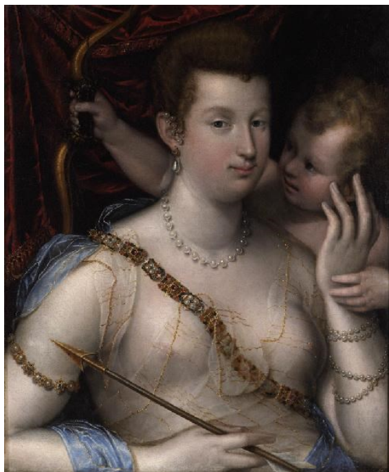
Lavinia Fontana (née en 1552– morte en 1614) Vénus et l'Amour Peint en 1592 Huile sur toile Salle 1.19