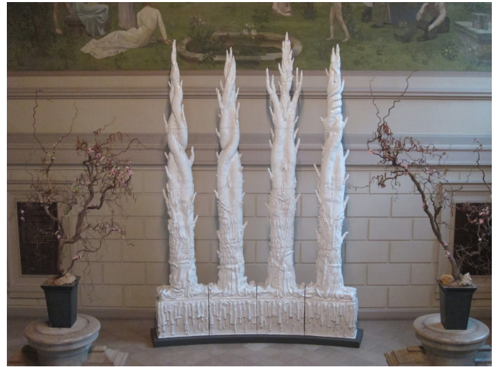
Elmar Trenkwalder (né en 1959) WVZ N° 18 Réalisé en 2005 Terre cuite émaillée Escalier d'honneur