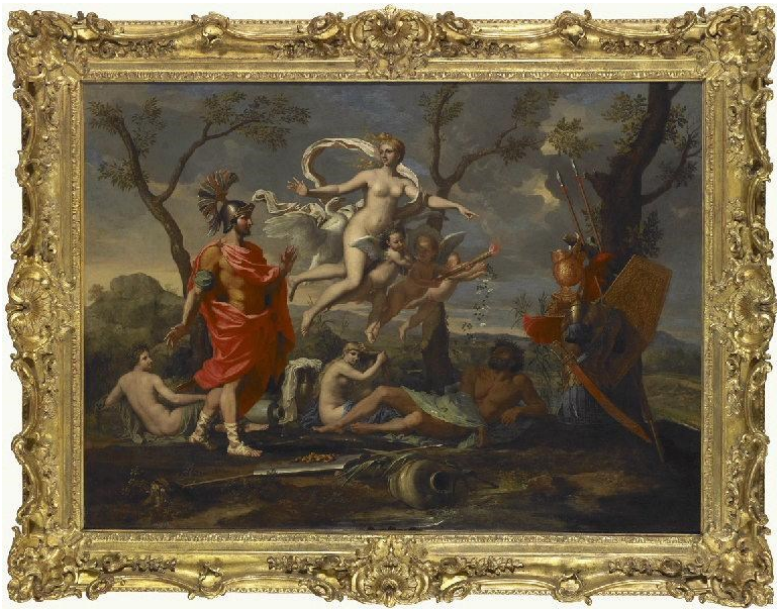
Nicolas Poussin (né en 1594– mort en 1665) Vénus montrant ses armes à Enée Peint en 1639 Huile sur toile Salle 2.07