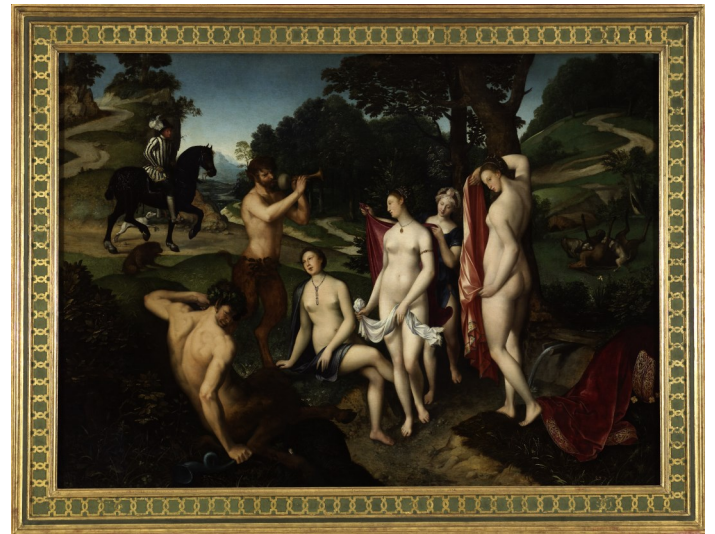
François Clouet (né vers 1510– mort en 1572) Le bain de Diane Peint en 1558-1559 Huile sur toile Salle 1.9