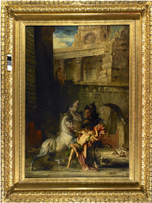
Gustave Moreau (né en 1826– mort en 1898) Dionysos dévoré par ses chevaux Peint en 1865 Huile sur toile Salle 2.27