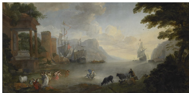
Hendrick van Minderhout (né en 1632-mort en 1696) Paysage avec l'enlèvement d'Europe Peint vers 1680 Huile sur toile Salle 1.11