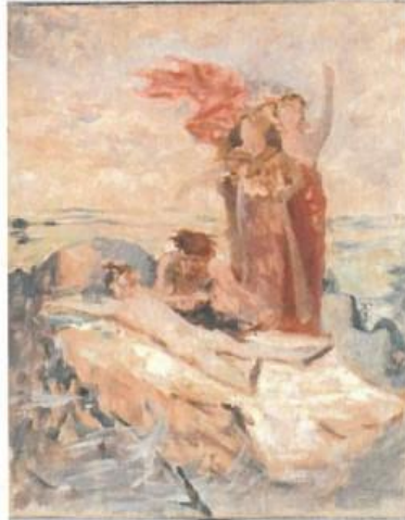
Evariste-Vital Luminais, Les Énergés de Jumièges , Étude préparatoire, avant 1880, Rouen, RMM, Musée des Beaux-Arts

Proposer des commentaires composés de textes sur le fleuve.