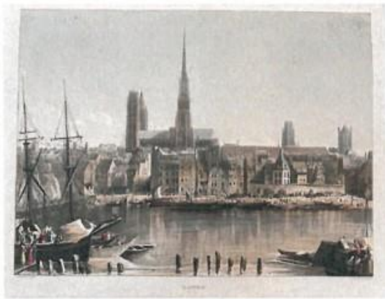
Jean-Baptiste Balthazar Sauvan, Vue de la Seine depuis Rouen, Normandie , Gravure, 25 x 30 cm, in Rudolph Ackermann (éd.), Picturesque Tour of the Seine from Paris to the Sea , 1821, Paris, Bnf