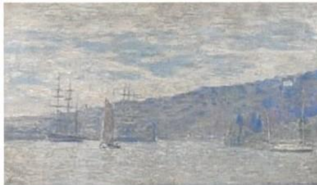
Paul-César Helleu, La Maison de Flaubert à Croisset , 1908, Huile sur toile, 55 x 95,5 cm, coll part

- S'appuyer sur ces deux poèmes pour écrire un poème personnel, en vers ou en prose, sur le fleuve, métaphore de l'amour à l'épreuve du temps.