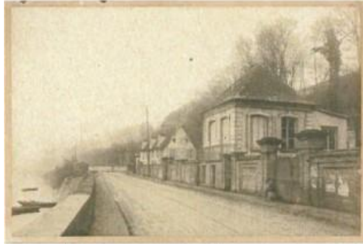
Clovis Petiton, Pavillon [Flaubert] avant sa restauration [côté rue] , non daté, photographie colée sur carton, 19 x 28,5 cm, Rouen, RMM, Pavillon Flaubert

La Seine a bercé et accompagné Gustave Flaubert tout au long de son existence. Né à Rouen en 1821, il passe la plupart de ses vacances en famille à Nogent-sur-Seine avant de s'installer, en 1846, dans une propriété en bord du fleuve, à Croisset, où il a écrit la plus grande partie de son œuvre.