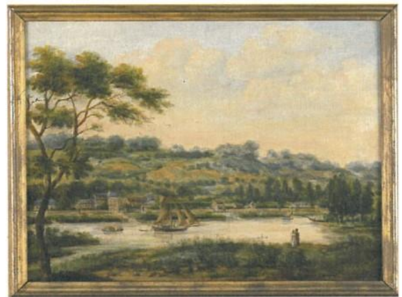
Mme Fleury-Barabé, Les bords de la Seine à Croisset en 1821, 1919, Huile sur toile, 55 x 47 cm, Rouen, RMM, Pavillon Croisset