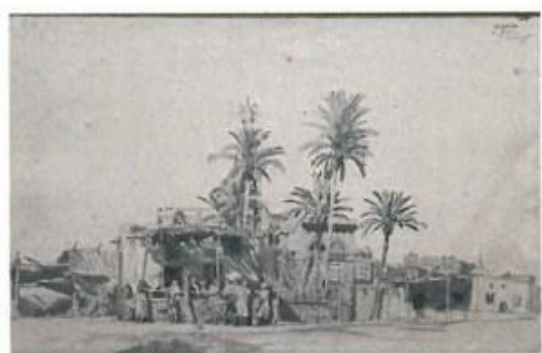
Prosper Marilhat, Les bords du Nil , n.d., eau-forte, coll. Étienne Arago

- Lire et étudier des poèmes sur des êtres surnaturels comme Mélusine et /ou Ondine ou sur des lieux merveilleux liés à l'eau.