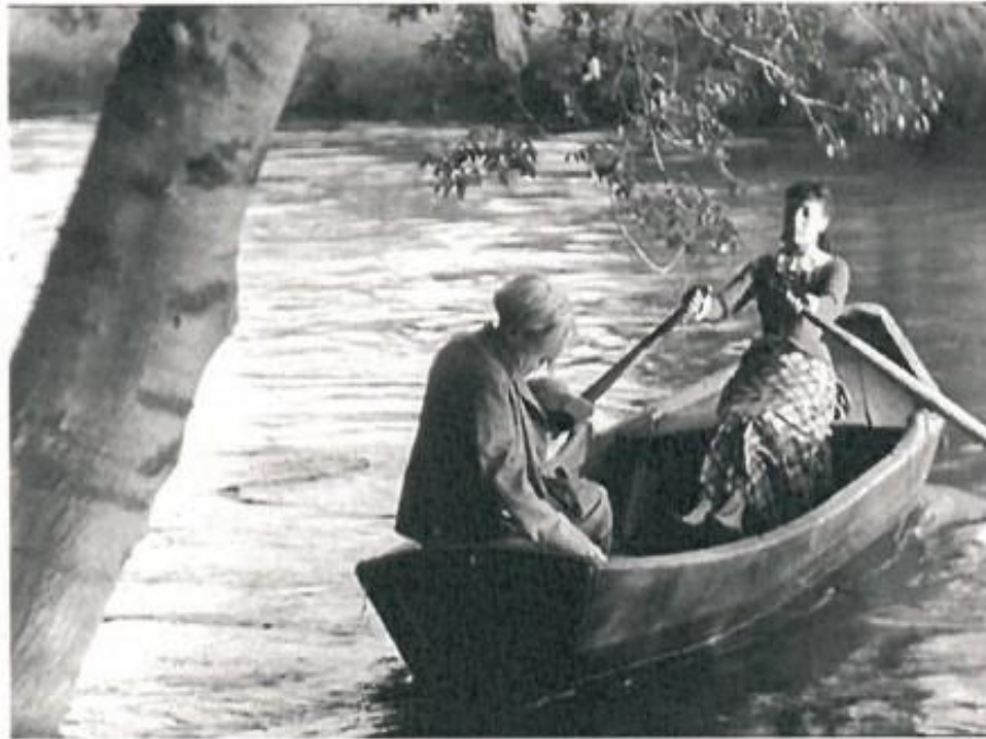
Jean Renoir, Une partie de campagne , 1946, photogramme

Gustave Flaubert, de sa naissance à sa mort, ne s'éloigne guère du fleuve qui constitue une authentique source d'inspiration. Cette poésie du fleuve sera explorée à travers des extraits de texte de Flaubert qui seront mis en résonance avec des créations visuelles et audiovisuelles illustrant les thématiques de la rêverie, du voyage, Flaubert ayant connu aussi le Nil, mais celle de cette mélancolie, liée aux univers aquatiques, qui obsède Flaubert depuis sa prime jeunesse. Mais il s'agira aussi de montrer comment les artistes, après Flaubert, ont poursuivi cette exploration artistique de la Seine dans leurs romans et adaptations : de Maupassant à l'adaptation de Renoir d' Une partie de campagne en passant par Les Quatre nuits d'un rêveur de Robert Bresson ou l'installation fluviale de Sandra Binion, une esthétique littéraire, plastique et cinématographique s'affirme en témoignant de la présence puissante de la Seine dans l'imaginaire collectif.