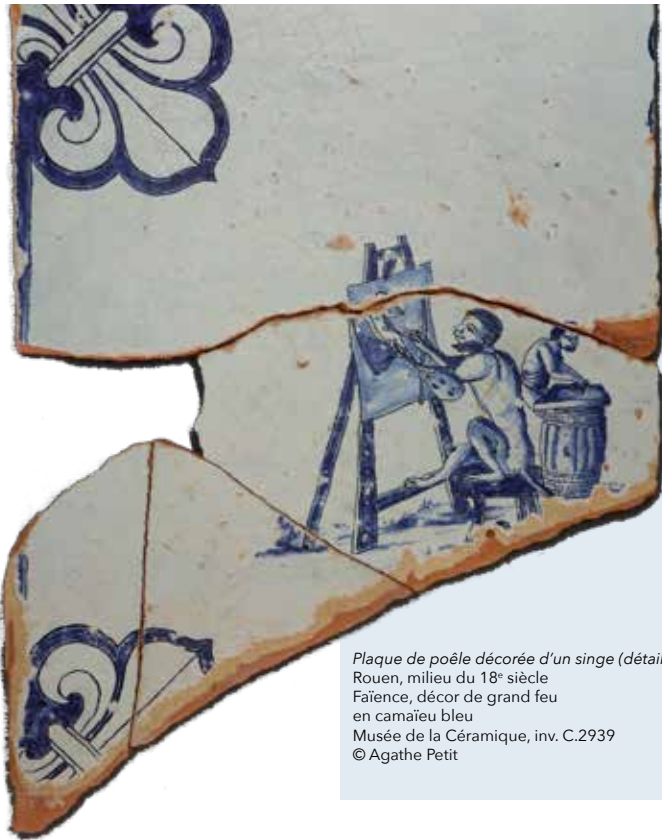
Plaques de poêle décorée d'un singe (détail) Rouen, milieu du 18 e siècle Faïence, décor de grand feu en camaïeu bleu Musée de la Céramique, inv. C.2939