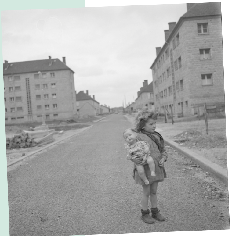
Petite fille au milieu d'un quartier HLM reconstruit Photographie Grand-Quevilly, 1952 Négatif photographique numérisé

En collaboration avec le service Villes et Pays d'Art et d'Histoire