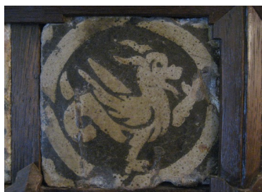
Pavés du Molay, XIV ème siècle.

L'activité, prévue sur une durée de deux heures, comprend :